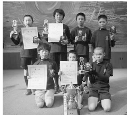
優勝 白浜スポーツ少年団 A