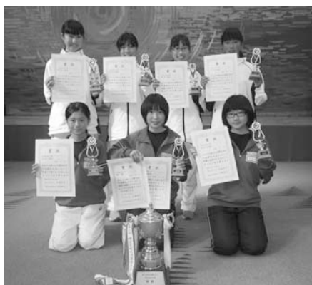
優勝 横芝中陸上競技部・バスケットボール部