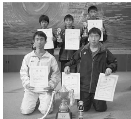
優勝 横芝中陸上部