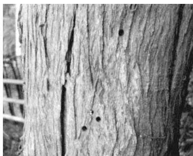
▶脱出孔(4mm程度の穴)