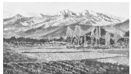
▲久保富男画 「吾妻小富士」