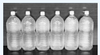
▲4人家族が1日に必要な水量です。(2ℓのペットボトル6本=12ℓ)

私たちが生きていくためには、1人1日に約3リットルの水が必要といわれています。災害に備え、家庭で簡単にできる水の備蓄方法として「くみ置き水」をお勧めします。「くみ置き水」は密閉できる容器に口元いっぱいまで水を入れて、日の当たらない涼しいところに保管し、3日に1度程度の間隔で入れ替えをお願いします。