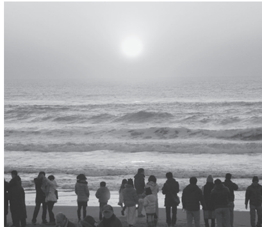
▲屋形海岸の初日の出