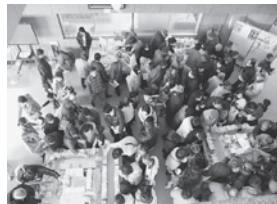
▲昨年度のリサイクル本フェア