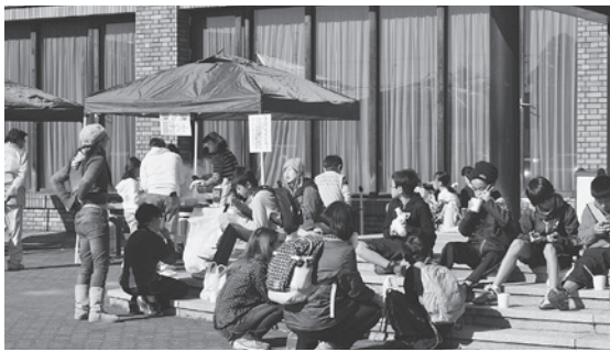
▶とん汁・わたあめの無料配布