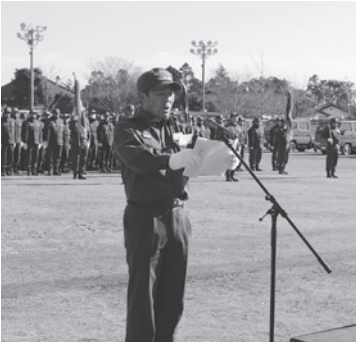
▶ 謝辞を述べる小倉本部分団長