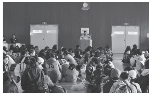
▶スタート前の注意事項

12月22日から28日までの7日間、町青少年相談員連絡協議会では、各地区ごとに「安全で安心して暮らせるまちづくり」を目指して、子どもたちの通学路、犯罪・事故等が発生しやすい危険な場所等を、青色回転灯装備車で広報をしながらパトロールを行いました。