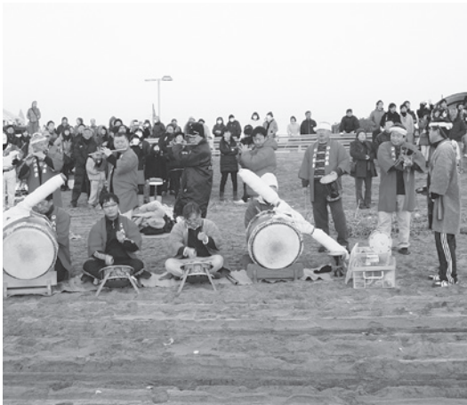
▲おはやしを披露する本町若連のみなさん