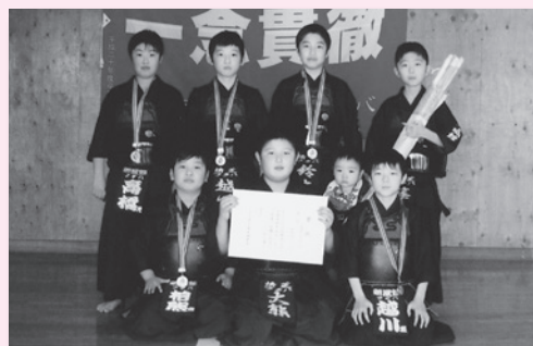
▲新風館フタバのみなさん