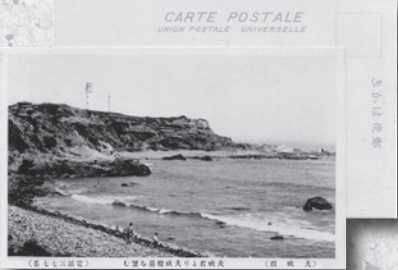
犬吠埼の風景の絵はがき

今では携帯電話のメールが、通信の主になってしまったが、たまにはがきで便りを受け取るのも捨てたものではない。ましてやきれいな絵はがきで、短い書き添えがあるとうれしくなる。絵はがきは、日本では近代郵便制度導入と同時に始まり、明治のころは様々な絵が描かれ、ブームになったこともあるという。大正の終わりから昭和になると、絵から写真が多くなり、観光地から軍関係、災害など、その時々々の情報を伝える手段ともなった。 下の写真は、銚子犬吠埼の風景を絵はがきにしたもので、年代は不明だが、おそらく昭和初期のものと思われる。今から八十年以上も前のものになり、犬吠埼の景観も灯台を除いて今と少し違っている。まだ写真 撮影が少なかった時代、このような絵はがきの写真は、当時の姿を知る貴重な資料となる。 今日、絵はがきより自分で描く絵手紙が流行り、多くのポストカードアートが生まれている。 町民ギャラリーでは二月八日から「絵手紙歳時記展」を開催しますので、その小さなアートをぜひご覧ください。 (社会文化課 道澤 明)