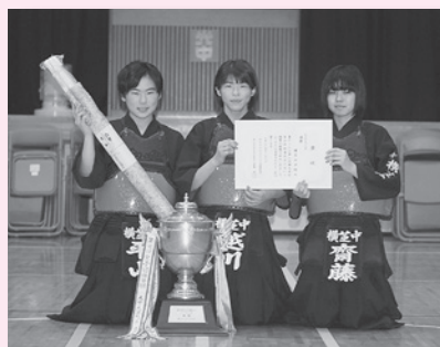
▲横芝中学校Aのみなさん