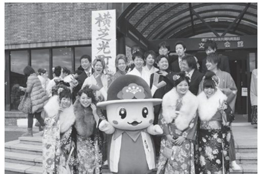
希望にあふれる新成人の笑顔