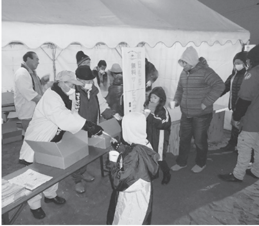
▲木戸浜海岸でのおしるこ・紅白もちの無料配布

今年も天候にも恵まれ、訪れた方々は新年のスタートに、太平洋から昇る雄大な日の出を見ることができました。