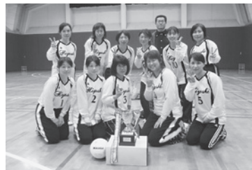
▲日吉チームのみなさん