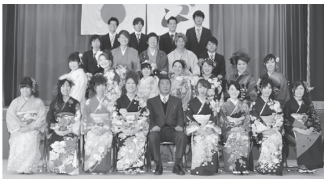
▶成人式実行委員のみなさん

「成人式」は、新成人の代表者と社会教育委員で構成された実行委員会のご協力により企画や運営等が行われました。