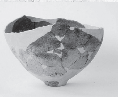
宮ノ前遺跡から出土した器

今から約二千年前、西の方から稲作文化を携えた人々がこの町にやってきた。その人々は弥生人とも呼ばれ、それまでこの地に住んでいた縄文人に稲作を教え、縄文人と融和して新しい文化を創造した。 その証拠となるものが、今回紹介する土器である。写真の土器は長倉の宮ノ前遺跡から出土した壺形の器である。上半分が無くなっているの、全体の形は分