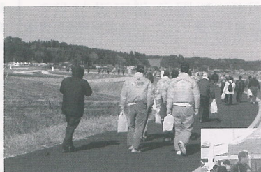
◀名所までハイキング

当日は、町内外から574人の参加があり、JR横芝駅をスタートし、坂田城跡の梅まつり会場などのハイキングコースを歩きました。