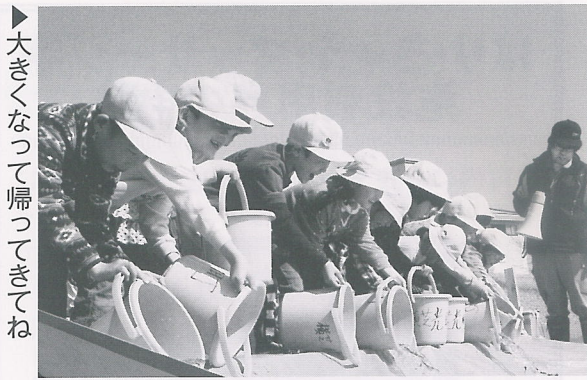
▶大きくなって帰ってきてね

栗山川漁業協同組合によると、今年魚道でとれたサケは274尾で、遡上のピーク時に大雨に見舞われたことなどから、実際はもつと多くのサケが栗山川を遡上しているとのこと。