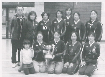
▲横芝クラブのみなさん