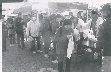
JR横芝駅をスタート▶