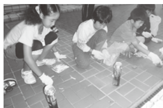
▲サバイバル飯づくりに悪戦苦闘!

町内の小学校6年生48人が参加し、テント張り、サバイバル飯づくり、カレーづくりの共同作業、紙トンボづくり・天体教室・ゲームを通して集団生活のルールを学び、お互いに理解や交流を深めることができた1泊2日になりました。