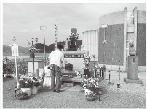
▲石巻市 大川小学校前の献花台

ける姿にただただ無言の私たちでした。 今回の視察でみなさんにお伝えしたいことはまだまだありますが、あえて申し上げたいのは、大きな地震の後の津波は何百年に1回と言われていますので、今までの経験での対応は非常に危険です。「まず避難すること」これに尽きると思います。