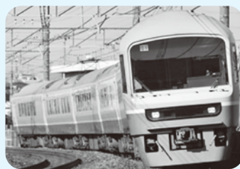
▲お座敷列車「ニューなのはな号」