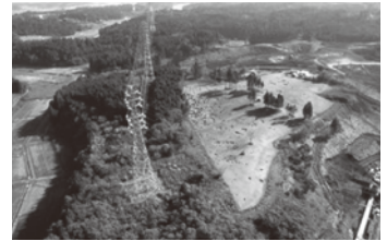
▲縄文集落跡東長山野遺跡