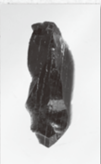
▶鍛冶屋台遺跡出土の黒曜石製石器

写真は、鍛冶屋台遺跡出土の三万年前の黒曜石製石器です。 今月十五日(土)から図書館町民ギャラリーで、考古資料で見る横芝光町の歴史展が開催されます。