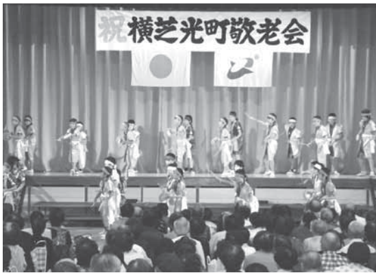
▲昨年の敬老会 ～横芝小エイサー隊～