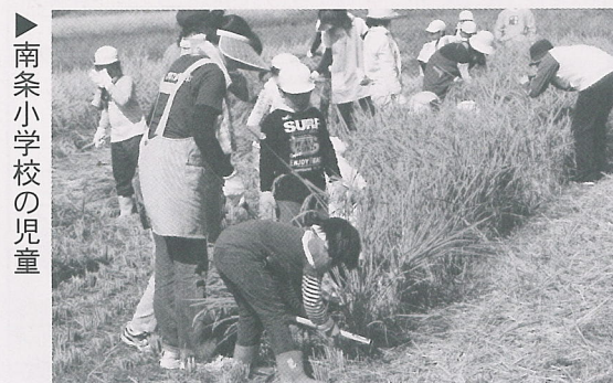
▶南条小学校の児童