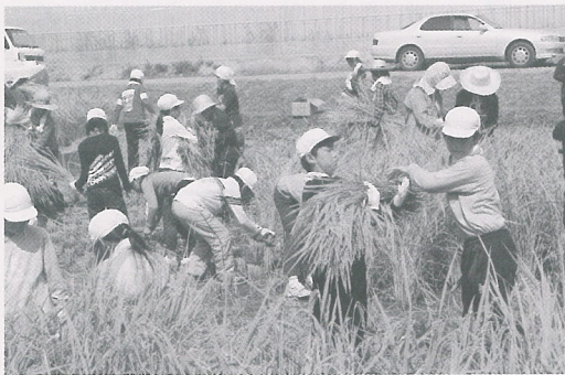
▶日吉小学校の児童

日吉小学校は4・5・6年生の児童が、南条小学校は1・2年生の児童と保護者がペアを組み、地元農家の方々の指導のもと、一株一株ていねいに鎌で刈り取っていました。