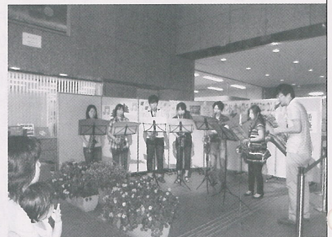
▲光ウィンドオーケストラ

ミニコンサートも今年で第8回を数え、リピーターも多く、たくさんの聴衆で図書館のロビーが埋め尽くされました。リラックスした演奏に、会場は和やかな雰囲気につつまれました。