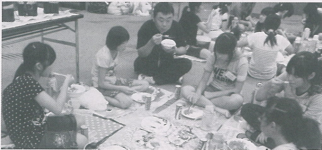
▲みんなで作ったカレー、おいしいネ!

町内小学校6年生47人が参加し、飯ごう炊飯、カレーづくり、火起こし体験、マレットゴルフ、天体教室等の共同作業の体験やレクリエーションを通して、集団生活のルールを学び、交流を深めることができた1泊2日になりました。