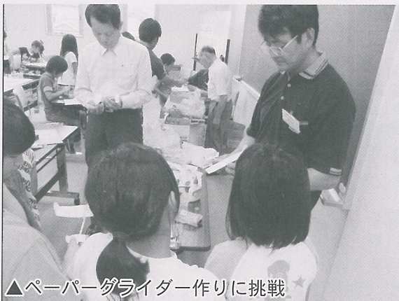
▲ペーパーグライダー作りに挑戦

7月28日、図書館で、子ども科学講座が開催され、ペーパーグライダー工作を行いました。39人の子どもたちが参加し、熱心に製作に取り組んでいました。実際に飛ばしてみるとよく飛び、とても楽しく有意義な講座となりました。