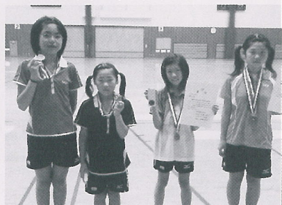
▼女子団体に出場されたみなさん