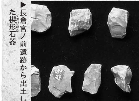
長倉宮ノ前遺跡から出土した楔形石器

千葉県ではこれまでに千ヶ所近い数の、旧石器時代遺跡が発見されています。町内でも十ヶ所の遺跡が見つかり、様々な石器が出土しています。その中から今回はなぞの石器を紹介しましょう。 町内から見つかった旧石器時代の石器は、今から三万年前から一万年前の、後期旧石器時代と言われる、旧石器時代最後の時期のもので、その種類はナイフ形石器や槍先、楔形石器などがあります。そのほか、石器を作る材料となる石片（剥片）や、石器を作ったときに出土した破片なども遺跡から出ました。 楔形石器は、石片を石の上に置いて、上から石片を打ち割ると、上下から割れて薄い石器が作られ、形が楔に似ていました。大きさは長さ二センチから大きくても五センチほどです。しかし、この石器がどのような、何に使われたかはその形からは想像できません。一つの遺跡からはいくつも出ているので、柄にいくつも着けて使ったのかも知れません。写真は長倉宮ノ前遺跡出土ですが、ほかに鍛冶屋台、寺方など銚子連絡道路建