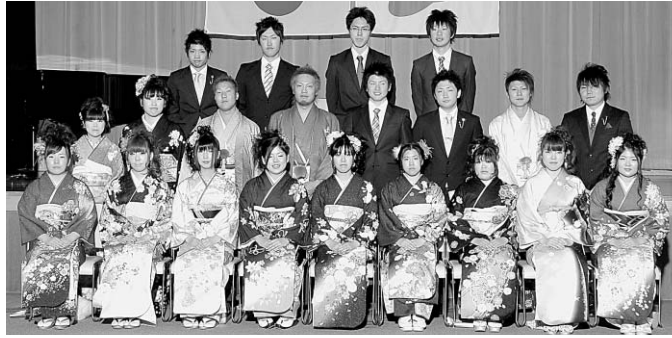
▲成人式実行委員会のみなさん