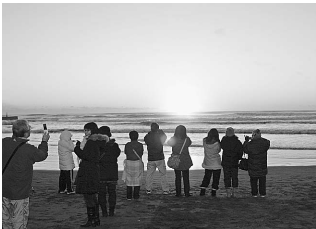
▲屋形海岸での初日の出

町観光協会主催の初日の出イベントが、木戸浜海岸、屋形海岸で開催されました。両海岸で約4,000名が集まり元旦早朝の寒さの中、訪れた人達に暖をとってもらおうと、たき火がいくつも用意され、お汁粉・あま酒なども振る舞われました。雲がない水平線からの見事な初日の曙光が、一面をオレンジ色に染め上げました。