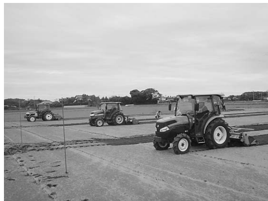
▲トラクターで「操・耕・守」を競う

10月29日、北清水ライスセンターを会場に農業機械の効率的利用と農作業安全の推進を目的とし、第5回町農業トラクター技術競技会が開催されました。