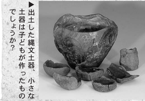
▶出土した縄文土器、小さな土器は子どもが作ったものでしょうか？

今から二十五年ほど前に発掘調査された東長山野遺跡からは、膨大な量の縄文土器が出土しました。同遺跡は今から五千〜四千年前の縄文時代中期に栄えた集落遺跡で、全体の半分しか発掘しませんでした。居住跡が五十軒ほどと、二百基以上の貯蔵穴が検出され、多くの人が住んでいたことがわかりました。その多くの人々が作り、使った縄文土器は食べ物を入れておいたり、煮たりするものも多く、大きなものは高さ一メートルあるものから、小さいものは十センチに満たないものまでありました。今回はその中で、小さい土器を取り上げてみました。