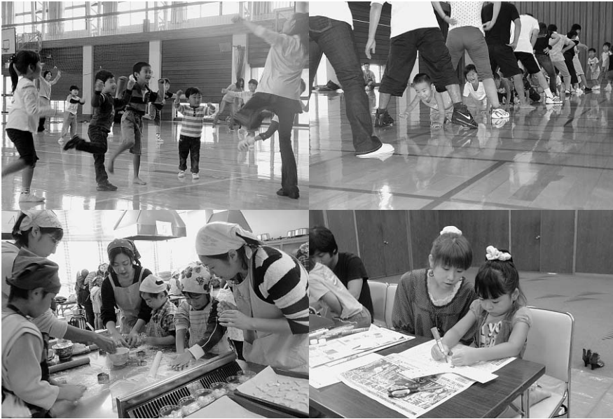
▲第4回 ～かんたんおやつをつくろう～ ▲第2回 ～おもちゃをつくろう～