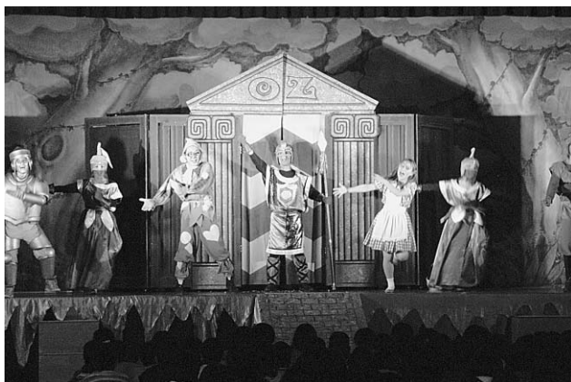
▲トマト座による「オズの魔法使い」