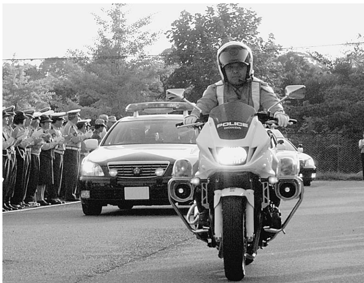
▲スローガン ～安心を 光で届ける 反射材～

9月21日、秋の全国交通安全運動の実施にあたり、日頃から交通事故防止に活動している交通関係機関・各団体の意思統一を図るため出動式が役場庁舎駐車場を会場に行われました。出動式会場が山武警察署以外で行われるのは初めてです。式典は光中学校吹奏楽部の演奏から始まり、各関係団体の巡検、各関係機関の代表のあいさつした後、パレードが行われ秋の交通安全運動がスタートしました。