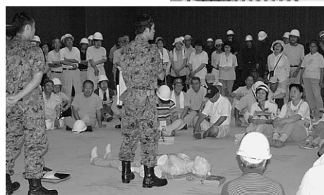
▲住民のみなさんをはじめ、関係機関のご協力ありがとうございました。