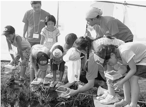
▶ホタルの卵を放流

田園で見かけることが少なくなったホタルの復活を願い、八日市場青年会議所の呼びかけで、近隣の小学生を対象に「ホタル復活隊」が結成され、7月31日、青年会議所会員により原方地区内に造られたビオトープにホタルの成虫と卵を放流しました。