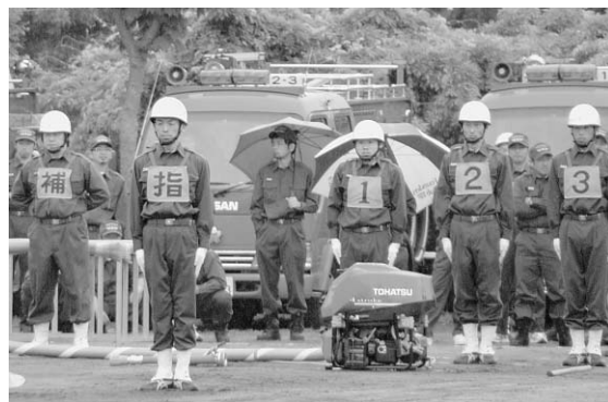
▲第8分団第1部（長塚・木戸・五ノ神）