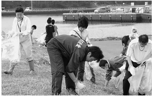
▲栗山川環境周辺ボランティアには敬愛高校の生徒も参加

地域の住みよい環境の維持、わが町の象徴である栗山川の景観を守り、観光資源である木戸・屋形海岸周辺のより良い環境づくりのため、ボランティアによる清掃活動が行われました。5月30日の町内一日清掃では地区役員をはじめ大勢が参加しました。6月13日の栗山川周辺環境ボランティアには555人、6月16日の海岸清掃には、上堺・白浜小学校の児童を含め430人が参加し、それぞれが環境美化のため作業に汗を流しました。