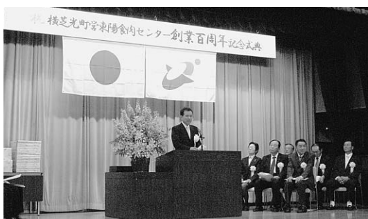
▲創業100周年を記念して盛大に式典が行われました

明治43年5月に現在の宮川地区約300坪の敷地に創設されました。創業当時は獣肉を食する習慣がありませんでした。大正10年頃には、三里塚（現成田市）方面の