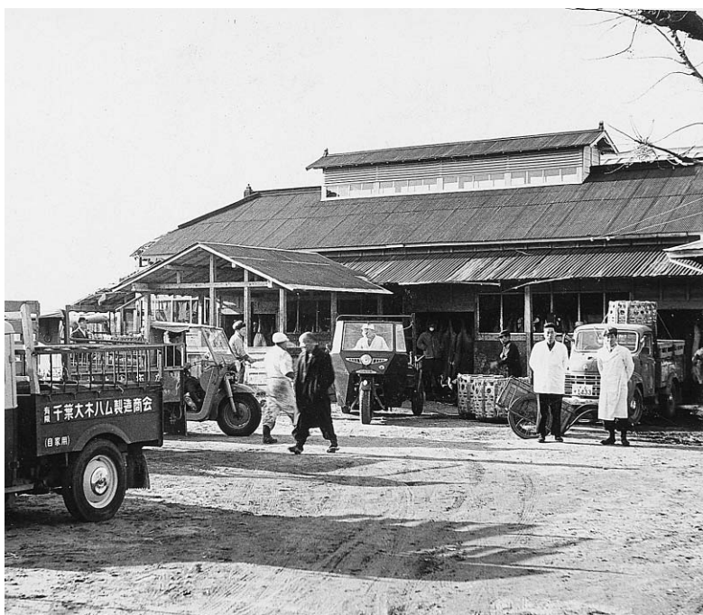
▲村営から町営となった昭和30年頃のと畜場