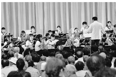
▲横芝中学校吹奏楽部