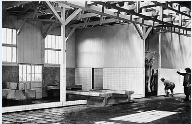
昭和30年頃のと畜場の内部