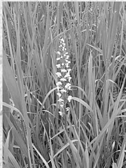
▶湿原に咲くミズチドリ

真夏が近づくころ、篠本の湿原には、穂を立てたように咲く純白の花が見られます。この花はミズチドリと呼ばれる、ラン科ツレサギソウ属の野生ランで、湿原に生え、全国的に分布しています。背丈が一メートル近くまで伸び、その先に二十〜三十輪、純白で一センチ足らずの千鳥が羽ばたくような花が咲きます。 湿原に咲く野生ランではサギソウが知られ、成東の湿生食虫植物群落でも見られますが、ミズチドリは背丈が一メートル近くになるのに、花自体はひとつが一センチ足らずと小さいところから、あまり知られていません。しかし、湿原の中で多くの花をつけた穂が立つ姿は、よく目立ちます。 このミズチドリが咲く篠本の湿原には、このほか梅雨時にノハナシヨウブ、初秋にはサワギキョウと、周 辺ではあまり見られない湿原の花が咲きます。そしてこれらはどちらかというと、高原の湿地(高層湿原)によく見られる花です。ミズチドリも全国的に分布するといいましたが、図鑑で調べると大陸のシベリアまで広がるこのことす。そうしてみるとこの篠本の湿原は、氷河時代の名残を示したところとも考えられます。そのような氷河時代の名残を見せる湿原は、この地域には貴重な存在で、保護しなければと思います。 ちなみにミズチドリなどの花は、坂田池公園内の湿生植物園でも見ることが出来ます。