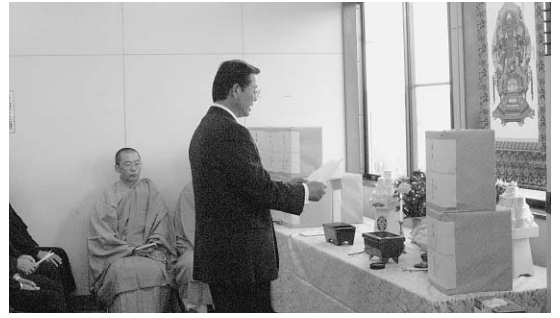
▲毎年行われる獣魂祭