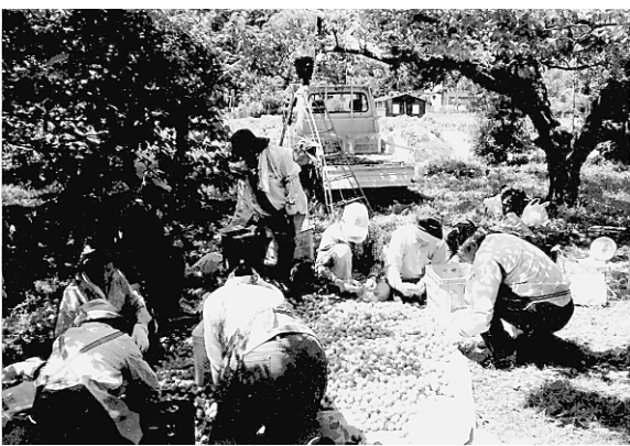
▲青梅を収穫する「生き活き横芝」グループ

青梅の実の収穫から加工までを体験してもらおうと6月5日、12日、19日、「坂田の梅まるごと体験教室」と題し、梅の加工教室ともぎ取り体験が行われました。町内外の参加者約60人は、ほんのり香る青梅の香りを楽しみながら、梅林組合直伝の加工方法を習得しようと、熱心に取り組みました。続いて行われた梅の実のもぎ取り体験では、たわわに実る青梅を見つけ、2kg入るカゴを片手にあふれんばかりに収穫し、参加者には笑顔がこぼれていました。毎年参加する人もおり、梅農家の応援団を募り始まったこのイベントが、生産者と消費者をつなぐ架け橋となっています。