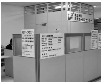
▲町民サービスセンター