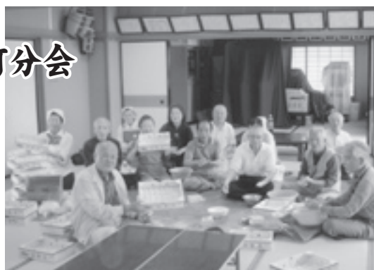
▲東町区のみなさん

この事業は今年で9年目となり、「毎年ありがとう」「ゴキブリがいなくなり助かります」とお届けしている方々に喜ばれています。