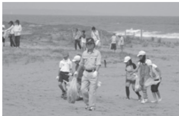
▲地元小学生も参加し、きれいな海岸に！