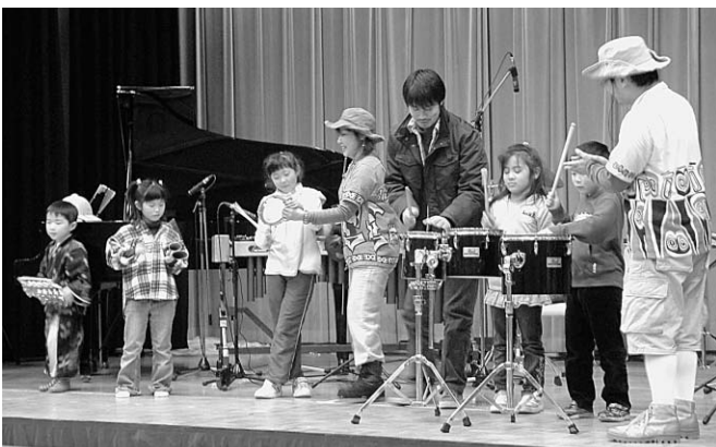
▲ 探検隊と演奏を楽しむ子どもたち