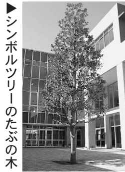
シンボルツリーのたぶの木

や学年集会にも利用できる多目的室を備えています。武道場やアリーナは地域のスポーツ活動にもご利用いただけます。 また、地域防災面も考慮し、避難所となる講堂棟内に防災倉庫を備え、そのほか飲料水タンクの耐震対策や防災用トイレを整備、更には災害時には家庭科室から飲食の提供をできるようレイアウトしています。