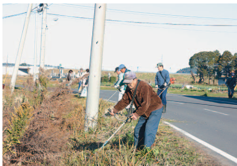
▲雑草を刈り取り、見通しのよい道路に