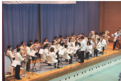
▲光ウインドオーケストラ