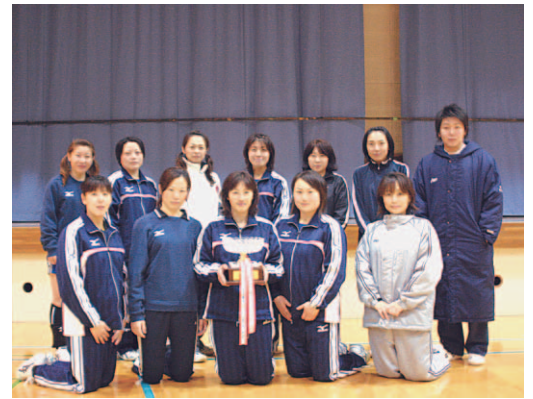
▲パワーズのみなさん