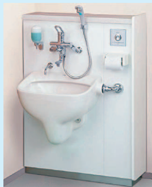
▶オストメイト対応トイレ

オストメイトの方は、直腸や膀胱などに機能障害を負い、腹部へ人工排泄口（ストーマ）を造設しており、排泄物を受けるための使い捨ての袋（パウチ）を常時接続しています。外出時に気軽にトイレを利用することができるよう、対応トイレの設置が求められており、近年、高速道路のパーキングエリアなどでも整備が進められています。