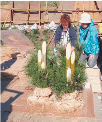
▲立派な門松が完成!

一方、テントに並べられた地元野菜や地元産品はすべて売り切れ。チャレンジテント名物の焼いもは、収穫後の甘みが最高にのっけて食べた方から「ほっぺが落ちるくらいおいしい」など楽しい会話も聴かれました。1月のチャレンジテントは、11日(日)に変更して行います。今年も各種楽しいイベントを計画し、みなさまのご来場をお待ちしています。