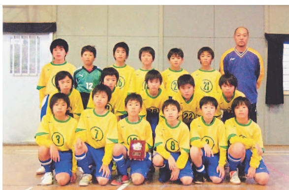
▲見事4位入賞 光J-E g g s

第22回小見川サッカー交流大会が11月8日・9日の2日間にわたり香取市で開催され、千葉県と茨城県から参加した24チームにより熱戦が繰り広げられ、光J-E g g sスポーツ少年団が見事4位に輝きました。