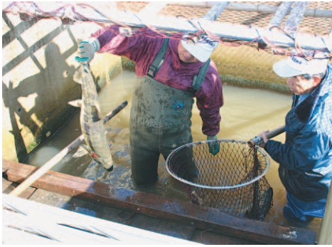
▶栗山川に大きくなって帰ってきたサケ

1月にはサケの里親事業で、小中学校及び希望者へサケの卵を配布。孵化・飼育した後、3月には稚魚の放流を行います。