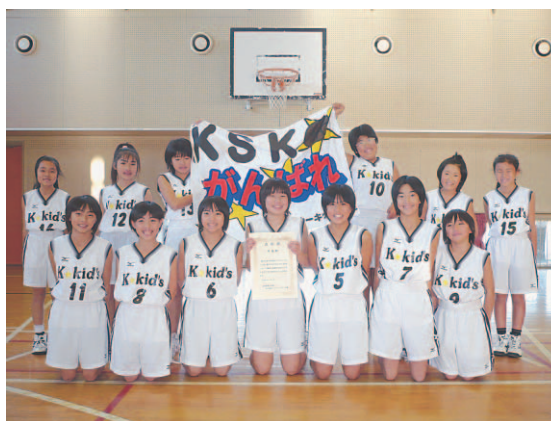
▲見事準優勝を収めた「上堺☆キッズ」

町内所属の2クラブチームを含む8チームで熱戦が繰り広げられ、決勝では「上堺☆キッズ」が「蓮沼ハッスル」と対戦し、接戦の末惜しくも敗れ準優勝を収めました。