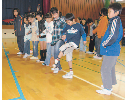
▲体育館でのレクリエーション