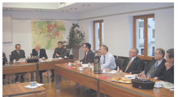
意見交換会（ドイツ・フライジング市にて）

現在、成田空港圏は成田市・山武市・香取市・富里市・芝山町・多古町・神崎町・栄町そして横芝光町の9市町で構成され、千葉県・国土交通省・成田国際空港株式会社加わりいろいろな問題や地域の発展について協議しております。特に昨年1月に発足した「成田国際空港都市づくり推進会議」は成田国際空港のポテンシャルを最大限に活かした地域づくりを協議する場として、9市町が地域で空港を支え、育て、各々が空港があるメリットを実感できるまちづくりを推進することを目的としたもので、以前からあつた協議会とは9市町が空港を支えるという点で異なるものと捉えております。その背景には、羽田空港の第4滑走路建設に伴う国際便枠の増便や、韓国のインチョン空港、中国の上海空港、香港空港などの整備拡充が進み、成田