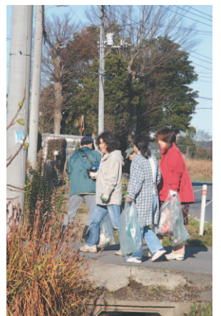
▲ゴミを拾ってきれいな町に!