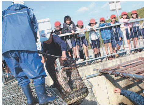
▶たくさんのサケを捕獲