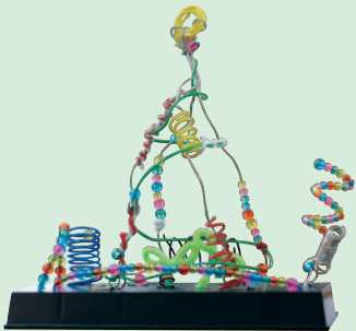
季節はずれのクリスマス