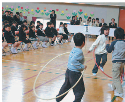
▲アトラクションで歓迎（上堺小学校）

やなわとびなどでアトラクションを行い「ほくたちと一緒にあそぼう！」と歓迎し新入生を迎えました。