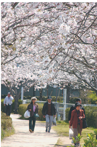
▲満開の桜の下を多くの人を通り抜けました。

公園を会場に桜まつりが開催され、町内外からおよそ3,000人が訪れました。まつり当日は天候に恵まれ約150本ある桜の花は満開をおかえ、公園には淡いピンク色をした桜のトンネルの下を散策する人、芝生の上にレジャーシートを広げのんびり過ごす家族など、思い思いの花見を楽しむ姿が見られました。また、会場には商工会をはじめ地元のみなさんが出店したテントが立ち並び、フリーマーケット、フワフワドーム、大声コンテストなども行われ賑わいを見せました。