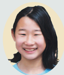
手作りトートバック