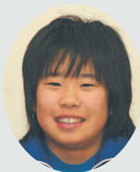
ミシンをする友達