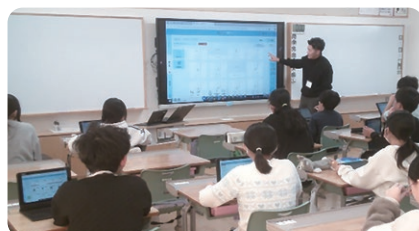
電子黒板を活用した授業風景