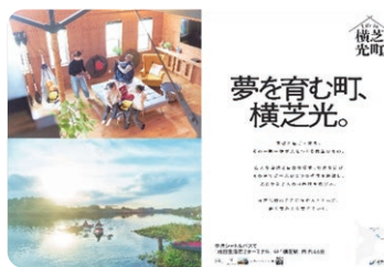
移住定住プロモーションポスター