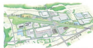
横芝光インターチェンジ周辺土地利用イメージ

さらに、航空機騒音対策の推進を図りつつ、成田国際空港への交通アクセス性などに優れた、空港と共生・共栄するまちづくりを進めます。