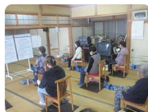
きらり若返り運動

一人ひとりの人権を尊重し、多様な人が参画する社会の実現を目指すとともに、外国人も暮らしやすい地域づくりを進めます。また、自治会をはじめとする地域コミュニティやボランティアなどのテーマコミュニティ（特定のテーマに基づき活動する集団）の活動支援に努めるとともに、地域における活動の担い手の育成や、新たな活動の創出を促します。