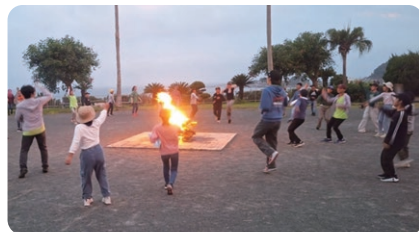
夏季ジュニアリーダー研修会