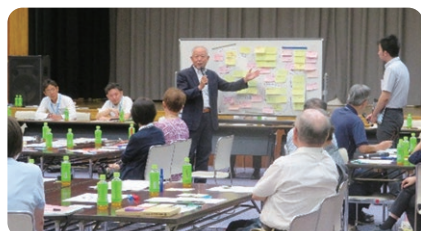
地域福祉計画・地区懇談会