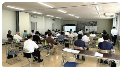
行政総務員連絡会研修会