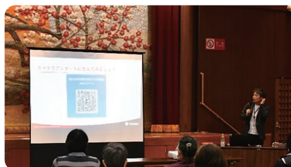
デジタルツール学習講座