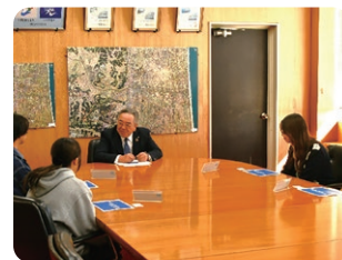
二十歳の若者と町長の対談

地域課題の解決に向け、行政運営の様々な場面において住民の積極的な参画を得るよう努めます。また、行政評価の実施やDX、民間活力の活用などを通じ効率的で効果的な施策・事業の展開に努めるとともに、健全な財政運営を推進します。