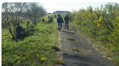
栗山川ボランティア