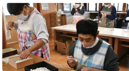
地域活動支援センター「たんぼぼ」