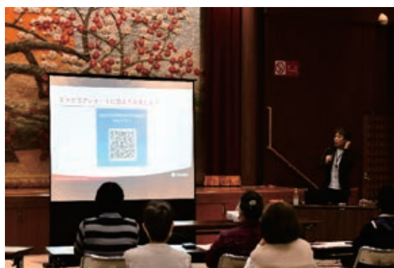
デジタルツール学習講座