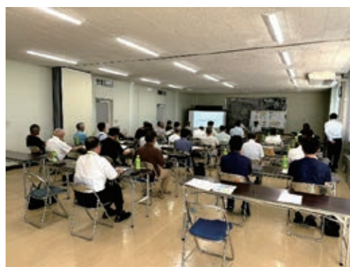
行政総務員連絡会研修会