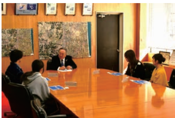
二十歳の若者と町長の対談