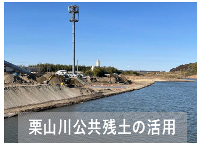
栗山川公共残土の活用