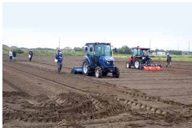
農業トラクター技術競技会の様子