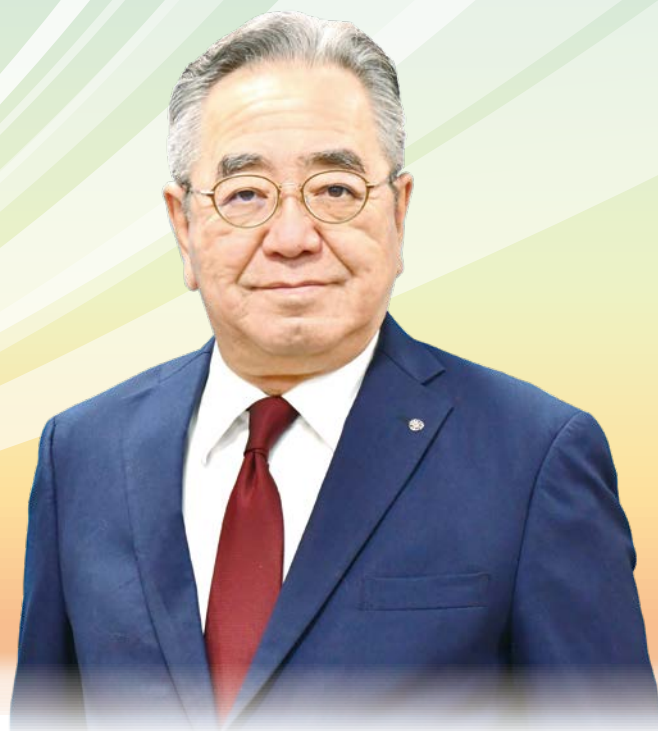
町 長 藤 晴 彦 佐