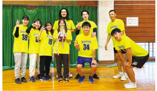
チャンピオンリーグ優勝 上町Aチーム