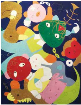
須之内靖子作「みんな仲間 ミックスメディア」(個人蔵)