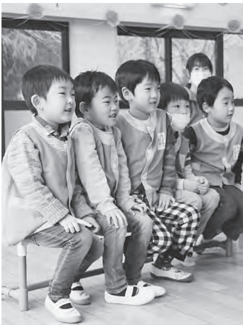
大総保育所お誕生会