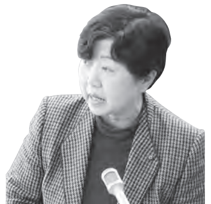
川島 富士子 議員