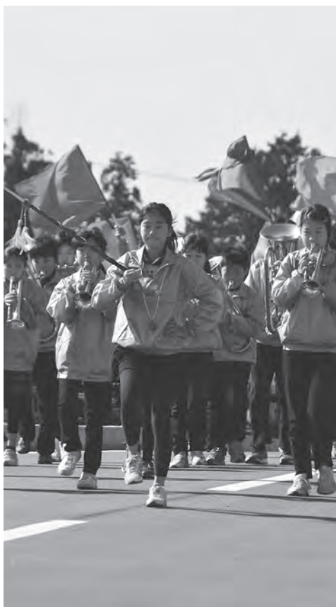
白浜小学校鼓笛隊