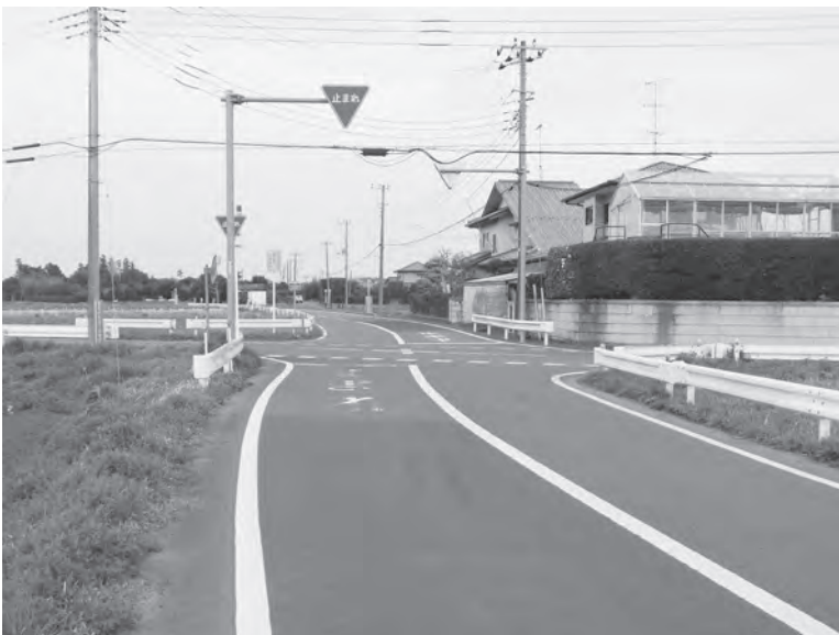
清長大橋付近交差点

間は横芝小学校と横芝中学校の児童・生徒の通学路となっていることから、防犯上必要な箇所については防犯灯の設置を検討してまいります。将来道路拡幅により交差点が大きくなった場合には、相応の道路照明灯の設置が必要と思われるます。