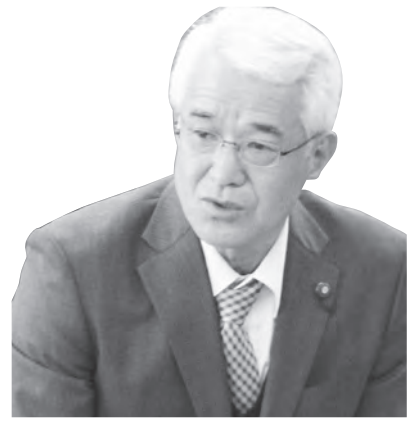
山崎 義 貞 議員