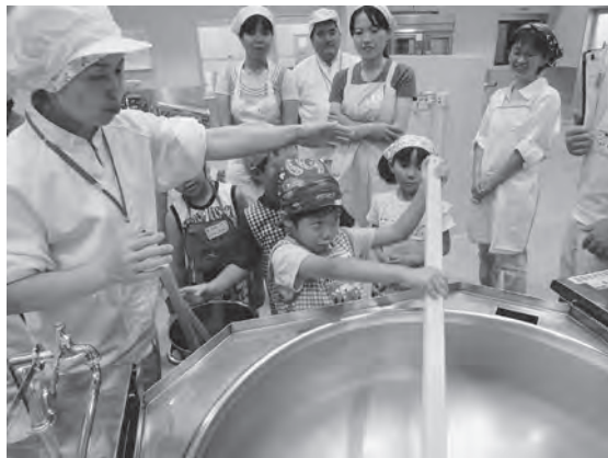
学校給食センター親子見学会

ゴミ袋料金の差額ですが、資源ゴミ袋については、山武環境が容量35ℓで20円、匝瑳環境は大と小がございまして大は40ℓで20円、