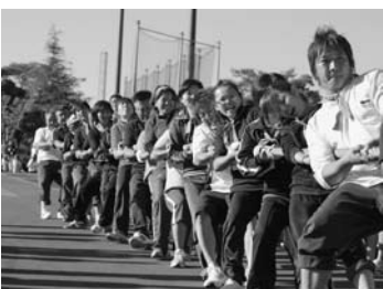
10月11日に行われた町民体育祭

実績報告に基づく過年度分支払基金交付金及び国・県負担金の調整、前年度繰入金の精算による一般会計への返還等、所要の項目に補正の必要が生じたため、歳入歳出それぞれ401万7千円を追加し、歳入歳出予算の総額を歳入歳出それぞれ501万7千円とするものです。