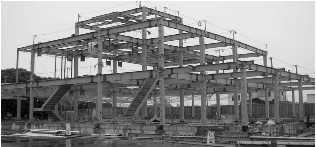
建築が進められている（仮称）横芝光町学校給食センター