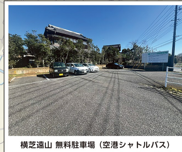
横芝遠山 無料駐車場 (空港シャトルバス)