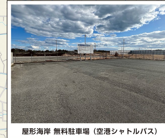
屋形海岸 無料駐車場 (空港シャトルバス)