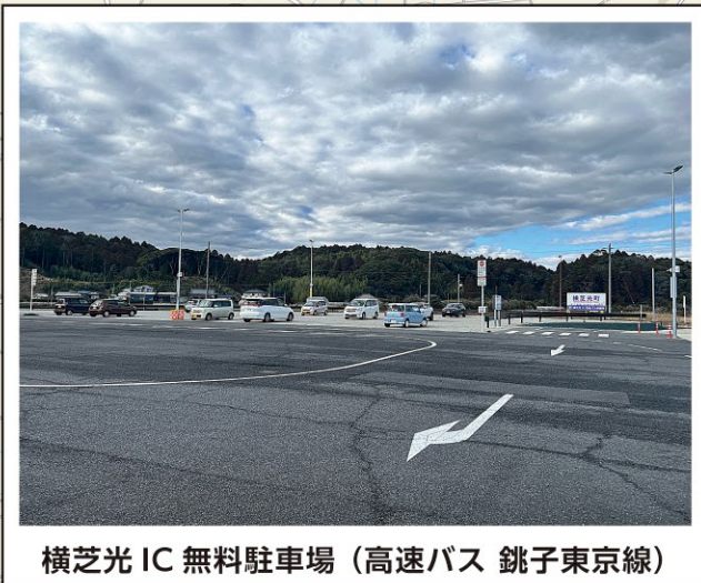
横芝光 IC 無料駐車場 (高速バス 銚子東京線)