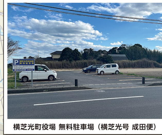
横芝光町役場 無料駐車場 (横芝光号 成田便)