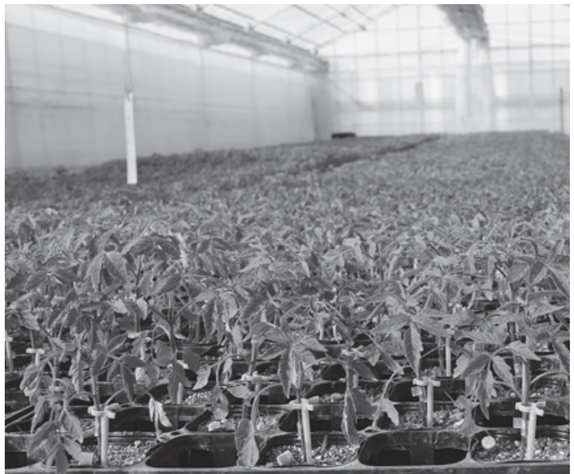
接ぎ木した苗が順調に育っています