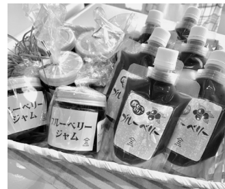
加工品の ジャム、ゼリー