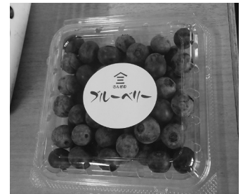
バック詰めされた ブルーベリー