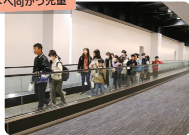
搭乗ゲートへ向かう児童