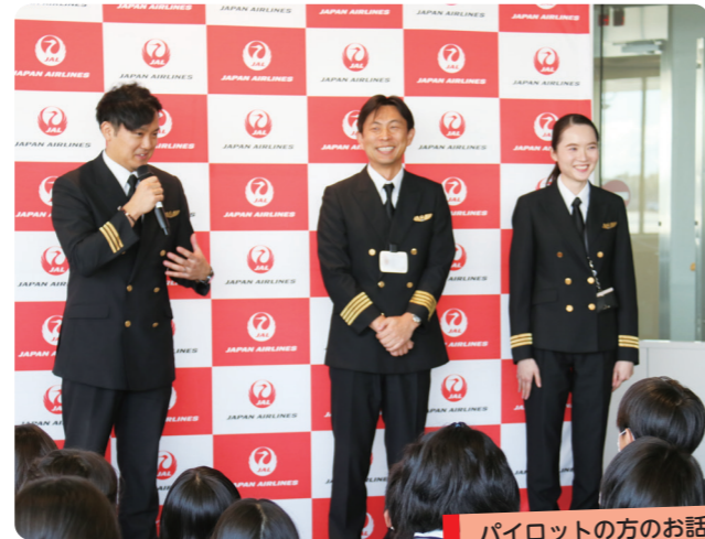
パイロットの方のお話

搭乗ゲートでは、代表の児童がキャビンアテンダントの方からアナウンスのコツについて教えてもらい、素晴らしい搭乗アナウンスを披露したり、パイロットの方から面白い話を聞き、とても盛り上がりました。