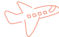
パイロット手作りマップ