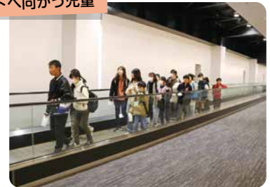
搭乗ゲートへ向かう児童