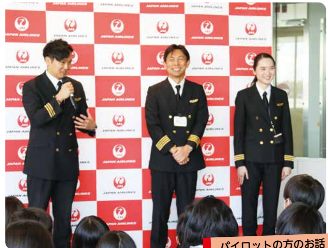
パイロットの方のお話