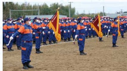
令和5年 出初式の様子