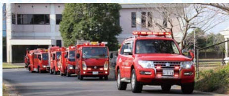
町内防火パレードを実施