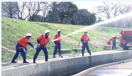
中継放水訓練の様子