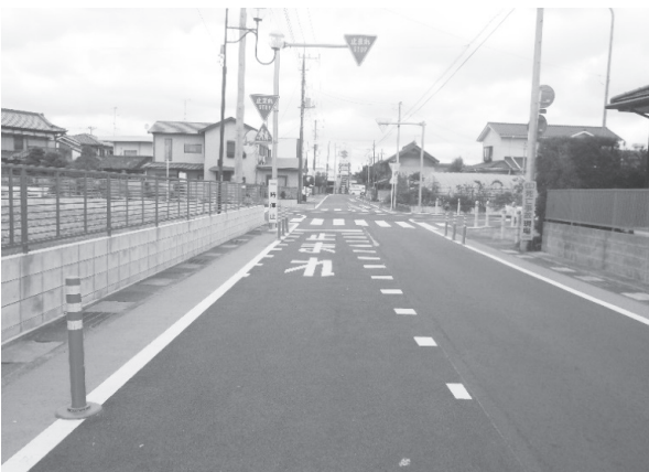
▲県道横芝下総線バイパス交差点

Q 引き続き警察への信号機設置の例外を認めってもらう為の根気強いアプローチをお願いいたします。