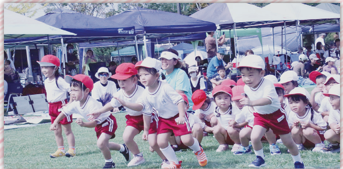
光町中央幼稚園・光町中央保育園・光町保育園