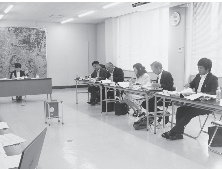
▲総務経済常任委員会

通常山武郡市で合同採用試験を行いますので業務委託はしません。令和4年度については、1回目の募集で当初の採用人数に満たなかったため、2回目の募集を行うために業務委託をしたところです。