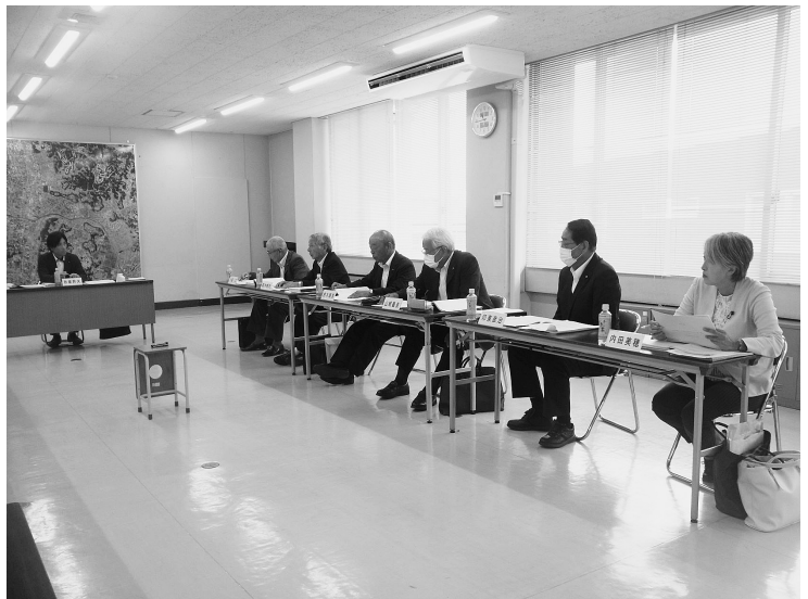
▲民生文教常任委員会

健康こども課へ相談があった場合は、保健師が対応し、こちらに相談できない方はメンタルヘルスチェックシステム「心の体温計」と、町ホームページにも相談機関一覧を載せております。また、昨年度の3月に各戸配布で相談機関一覧を載せたリーフレットを配布しております。相談機関一覧には厚生労働省や県が委託している民間の団体の連絡先が載っております。