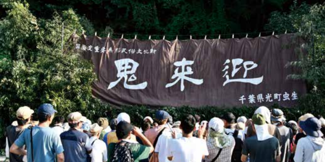
大勢の人で埋め尽くされた境内