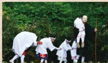
賽の河原 地藏菩薩が子どもの亡者を救い出す