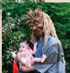
鬼婆が赤ちゃんを抱く虫封じ