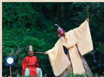
大序での閻魔大王(左)と俱生神(右)