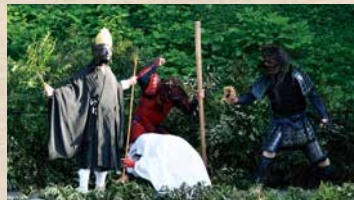
死出の山 観音菩薩が現れて亡者を救い、鬼と問答を交わす