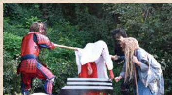
釜入れ 黒鬼、赤鬼が亡者を釜でゆでる