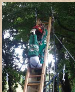
梯子上で逆立ち。獅子役2人の阿吽の呼吸が合っていないとできない