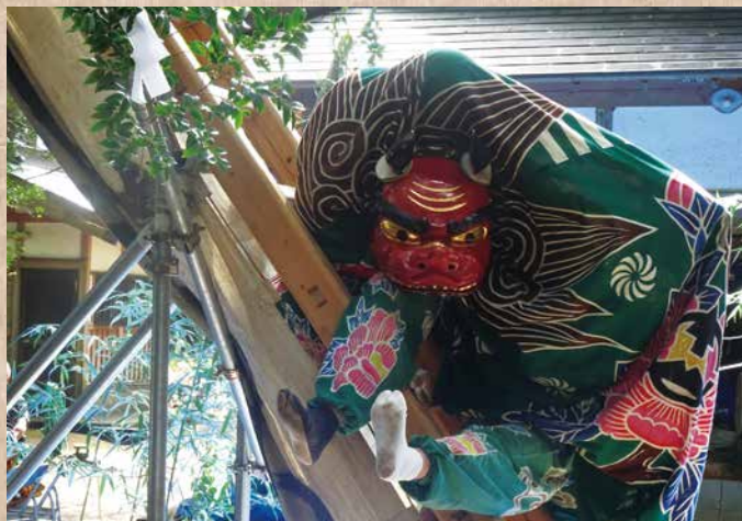
獅子は、周囲の悪霊を払いながらゆっくりと梯子を登る