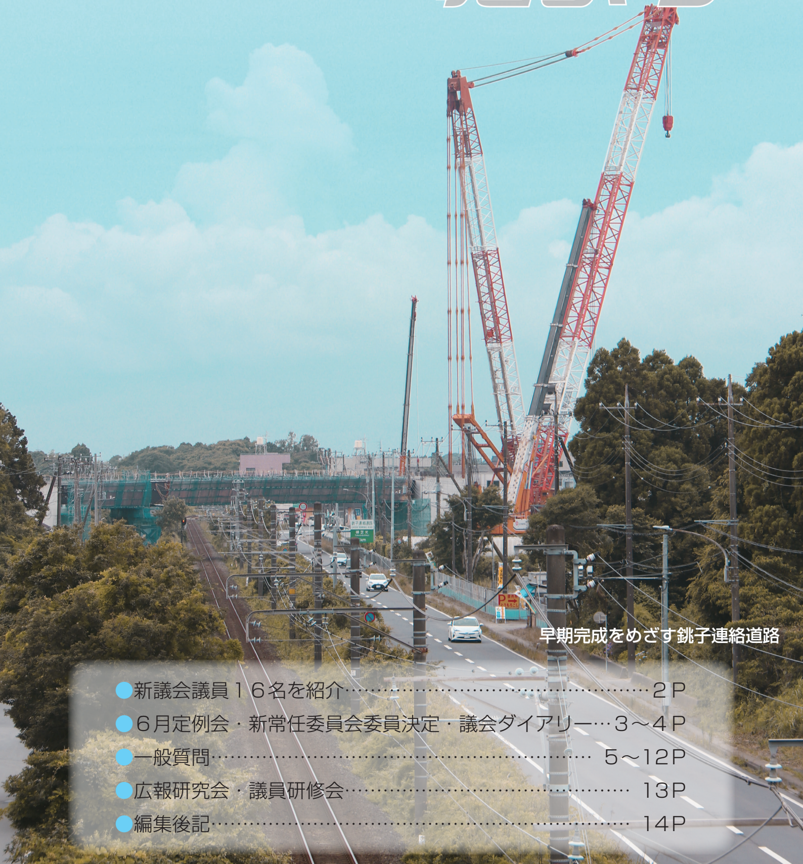
早期完成をめざす銚子連絡道路