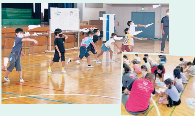
JAL折り紙ヒコーキ教室の様子(横芝小1・2年生)

令和4年度は、周遊フライトのほか、小学校低・中学年を対象としたJAL折り紙ヒコーキ教室や航空講話授業を行いました。