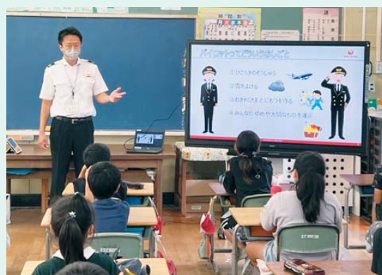
航空講話授業の様子(光小3年生)

町では、今後も『成田空港に近い町』である特性を活かし、成田空港や空港の仕事などの理解促進を図る事業を継続して実施していきます。