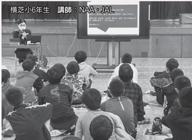
横芝小6年生 講師：NAA・JAL