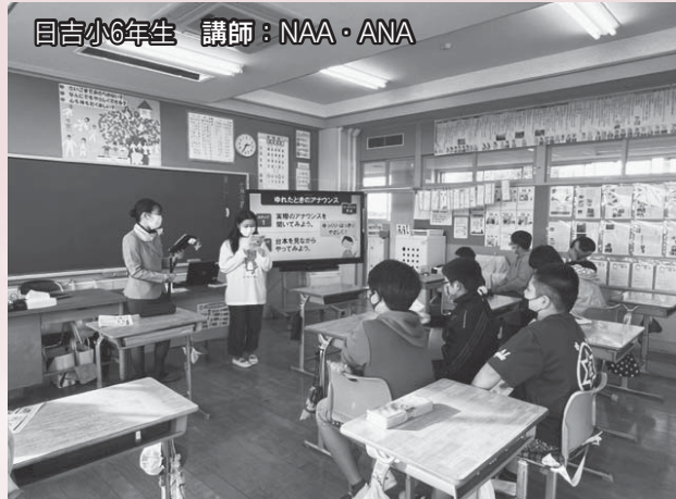
目吉小6年生 講師：NAA・ANA