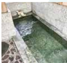
大浴場でゆっくり疲れをとろう。