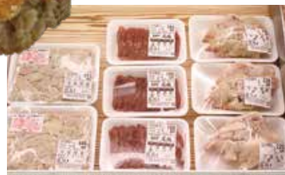
豚足、レバー、もつなど、元精肉店ならではの品揃え。