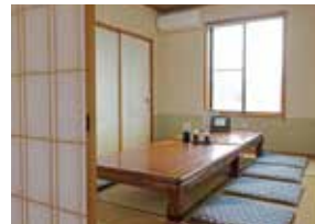
子連れ客に喜ばれる個室も。

千葉県山武郡横芝光町屋形5076-116 平日11:00~14:00、17:00~20:30 土日祝11:00~15:00、17:00~20:30 月は14:00閉店、火休(祝日は両日とも営業)