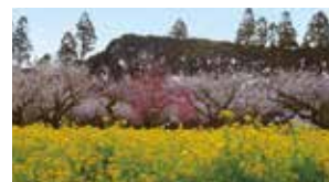
千葉県山武郡横芝光町坂田 2月中旬から3月上旬(梅の開花時期に合わせて開催)

梅の花の紅と白、菜の花の黄色が一度に咲きそろう「梅まつり」。梅農家の自家製梅干しや梅酒も販売する。