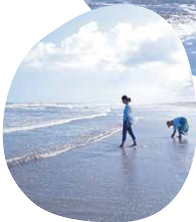
白砂が続く九十九里の海岸線。