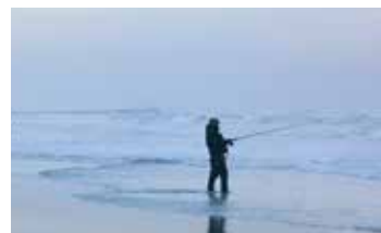
冬、早朝の海でサーフフィッシングを楽しむ人も。