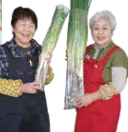
パート従業員のお2人