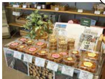
売店では町の特産品や飲み物などを販売。