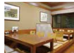
広～い店内。掘りごたつ、座敷や個室もある。靴を脱いでリラックス。