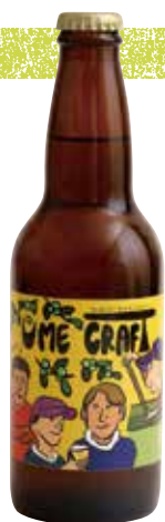
青い梅のクラフトビール 「UME CRAFT (330ml)」 660円。

香り高い梅をクラフトビールにして、その魅力をもっと広めたい。横芝光町宿泊組合が千葉市のクラフトビール醸造所「幕張ブルワリー」とコラボし、2023年に青い梅のクラフトビール「UME CRAFT」が誕生しました。