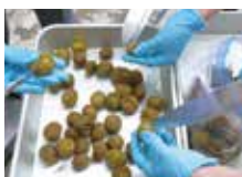
冷凍梅に切り込みを入れる。