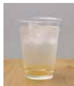
坂田城跡梅林で収穫した梅で作った濃厚な「梅ジュース」165円は館長の手作り。

千葉県山武郡横芝光町横芝1355-2 9:00~18:00 情報ラウンジ、待合所は8:00~20:00 ※季節により変更あり 無休(年末年始を除く)