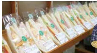
町内の「住吉屋本店」のサンドイッチも種類が豊富。

千葉県山武郡横芝光町芝崎2357-2 9:00~18:00 無休(年末年始を除く)