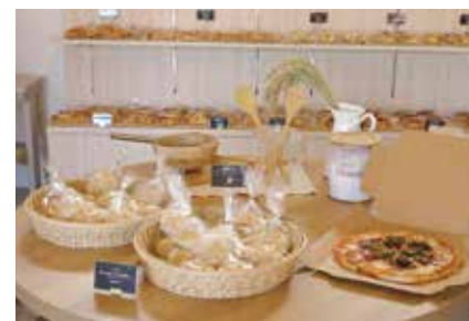
各種パン、とれたてフルーツを使ったタルトやロールケーキも販売。