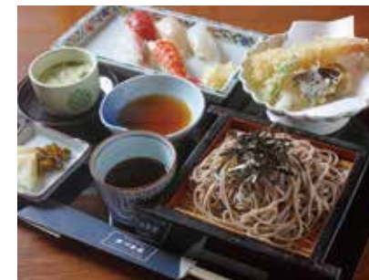
そばも刺身も天ぷらも食べたい！そんな人も大満足「あづま寿司セット」1498円。