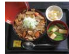
醤油ベースの甘辛味がおいしい 「栄養めし」800円。

千葉県山武郡横芝光町小田部604-1 11:30~14:00 (L.O.13:30) 17:00~22:00 (L.O.21:30) 月木、年末年始休