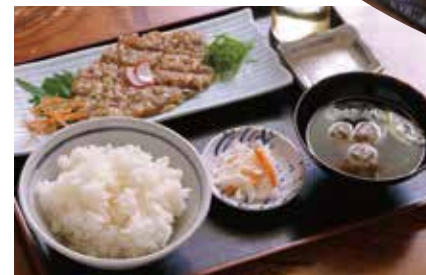
みそ味、お酢でいただく「なめろう」単品1100円。 つみれ汁ラissetで+473円。