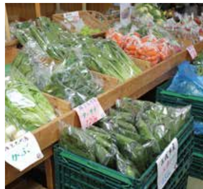
季節によってピーマンやオクラなどの詰め放題サービスも。