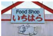
豚のマークが目印。