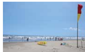
人混みが少ない、九十九里浜の穴場スポット。