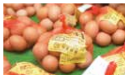
新鮮な卵もお土産として人気。