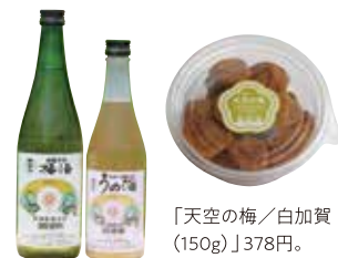
「天空の梅/白加賀 (150g)」378円。

梅酒や梅干し、冷凍梅などを販売。 「吟醸仕込梅酒」1350円(左)。 「純米大吟醸仕込梅酒」1750円(右)。