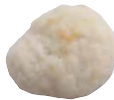
もちもち食感の「成型パン」 (3個入り)210円。