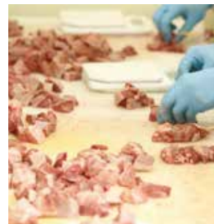
もつをていねいに串刺しに。橋村商店の加工施設。

町が運営する歴史と伝統ある食肉処理施設 あつあつのもつ鍋、カシラやハツなどバリエーション豊かなもつ焼き。古くから養豚業がさかんな横芝光町では、大正時代に日本人として初めて本格的なソーセージやハムの製造を始めた大木市蔵氏による「大木式ハム・ソーセージ」と並んで、新鮮なもつ料理が大人も子どもも大好きなソウルフードとして親しまれています。