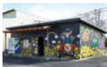
ほのぼのする外壁の絵は地元高校の美術部が描いてくれたもの。