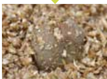
麦と合わせて熱を加える。