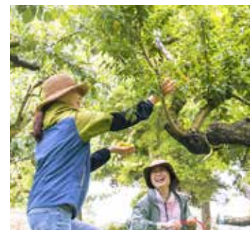
ひと粒づつ手摘みした梅の実は、いい香り。