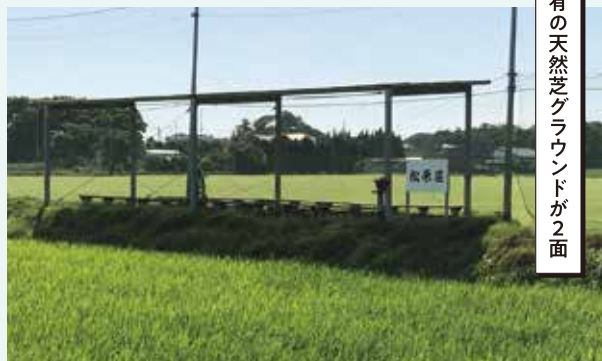
私有の天然芝グラウンドで心ゆくまでプレーを。