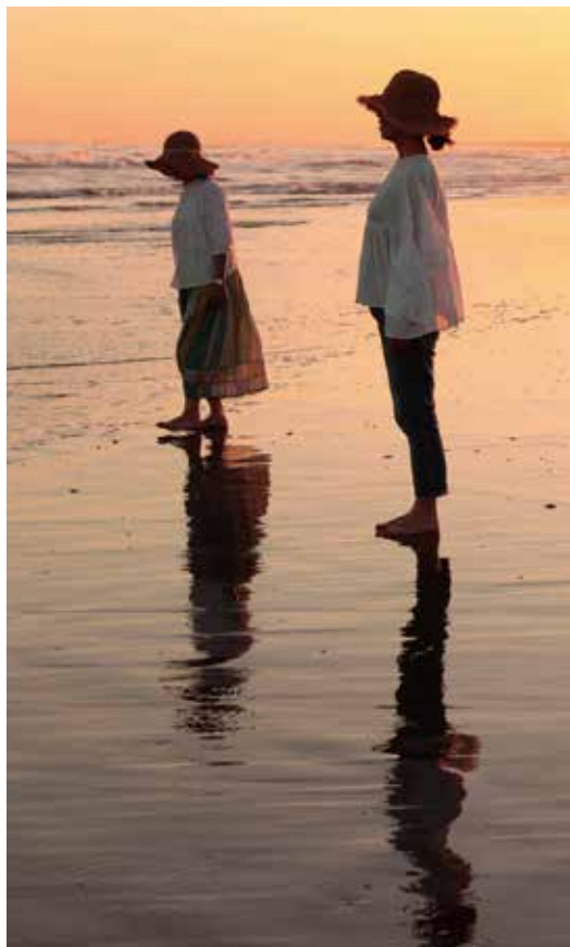
潮が引いたときに「水鏡」が見られる。

屋形海岸 / 千葉県山武郡横芝光町屋形地先字東雲 5356-1 木戸浜海岸 / 千葉県山武郡横芝光町木戸地先