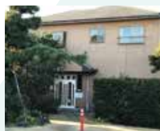
海まで歩いて5分。宿貸し切り、棟貸し切りも可能。

一年を通じて快適な気候の横芝光町は、スポーツ合宿の宿泊先としても根強い人気を誇る。民宿が天然芝のグラウンドや野球場を所有している宿もあるので、時間を気にせずのびのびとプレーに打ち込むことができる。