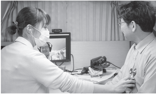
▲車に看護師が乗り医師はオンライン診療

移動式オンライン訪問診療所は、患者宅に看護師などの医療スタッフが乗車した移動診療車が出向き、病院の医師とオンライン診療を実施するもので、医療機関へのアクセスが難しい地域などで実証実験がされています。東陽病院では訪問診療・訪問看護ステーションを行っています。高齢者の増加に伴い在宅医療の必