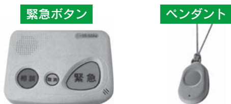
緊急通報装置(固定電話設置用)