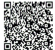
千葉県ホームページ

皆さんが参加できる「プラス防犯」の取組や防犯パトロールに関する情報を掲載しています。