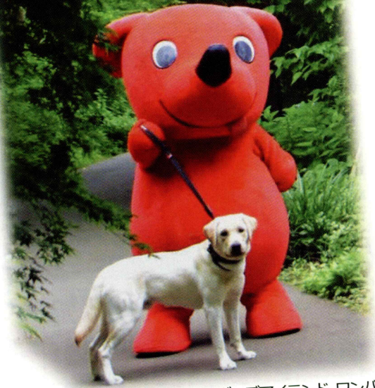
チーバくん & さとちゃん (ドギーズアイランド ワンバサダー)