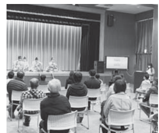
房総雅楽会による演奏鑑賞