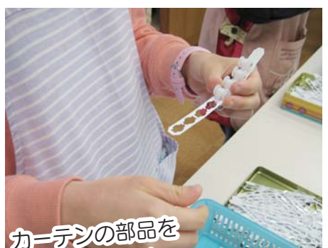
カーテンの部品を 数えて束ねます