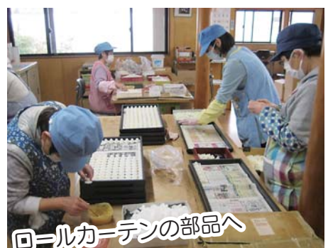
回ルカーテンの部品へ グリス塗り

横芝光町地域活動支援センター「たんぽぽ」は、健康づくりセンター「プラム」の敷地内にあります。地域で暮らし障がいによって働くことが困難な方の日常生活や社会生活など日中の活動をサポートする福祉施設です。現在のたんぽぽでは男性4名、女性7名の計11名が徒歩や保護者の送迎・公共交通機関などを利用し、月曜日～金曜日の週5日登所し、軽作業を行っています。