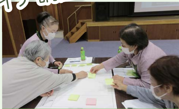
1日目：災害時の基本的な対応と備え