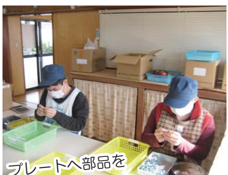
プレートへ部品を はめ込みます