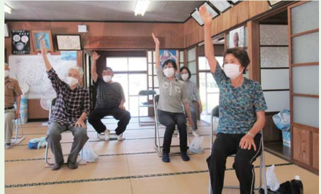
いすを使った簡単体操