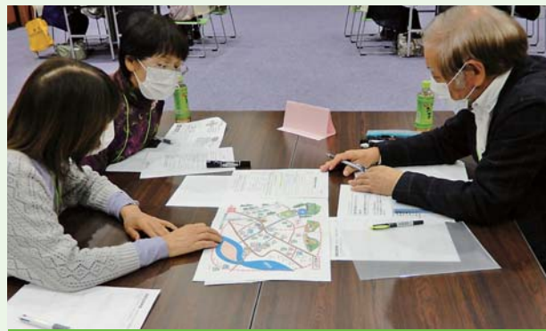
2日目：災害ボランティア活動について