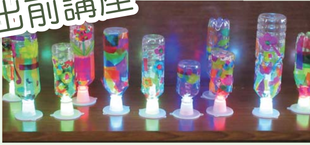
ペットボトルランプ製作中

コロナ禍で事業が中止され、ご近所の気の合う友達とも会えずにいる状況が長く続いている中でも何かできることはないか？と考え、近くの集会所に集まりペットボトルランプの作成や軽体操など少人数でもできる講座を新しく取り入れてみました。