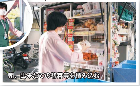
朝、出来たての惣菜等を積み込む