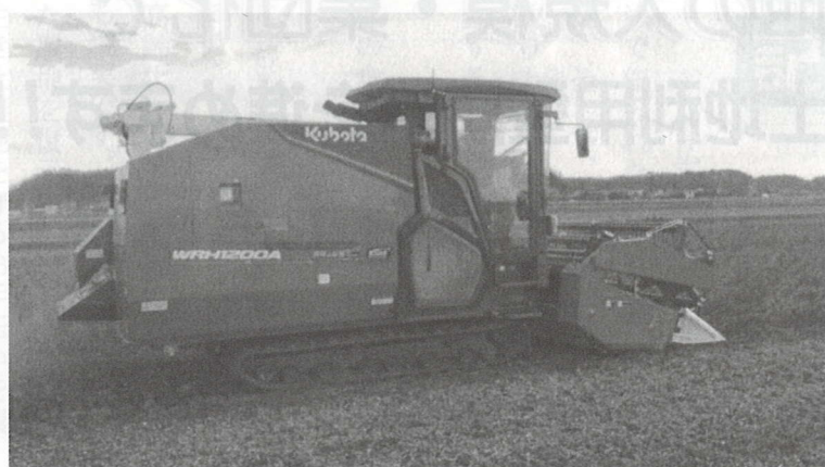
アグリロボコンバイン