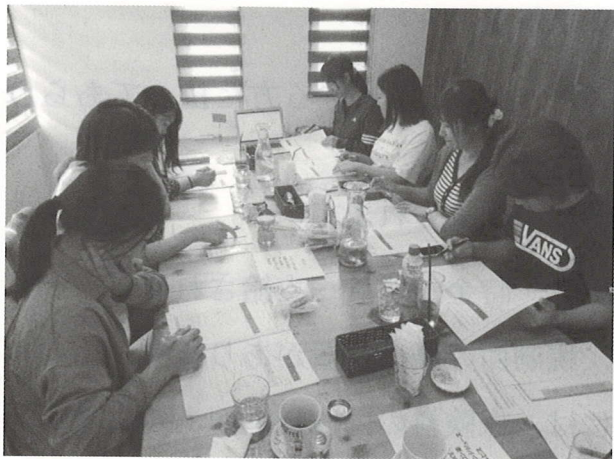
研修会（ライフプラン）