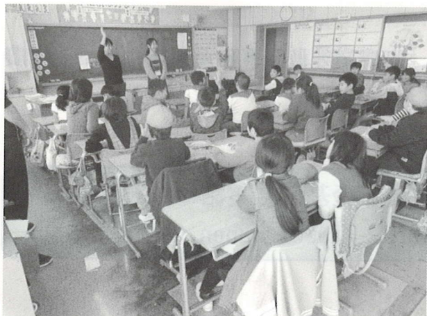
学校給食交流（横芝小学校）