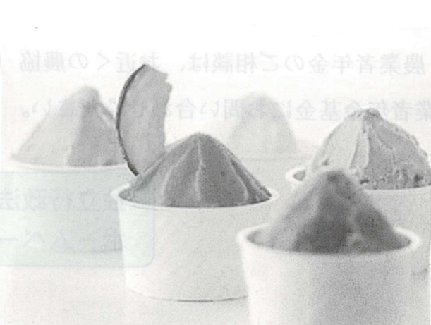
地産地消アイス（イメージ）